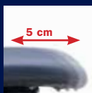
Schiebesitz/ Sliding seat