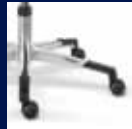
Fußkreuz Aluminium poliert/ Polished aluminum base