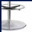
Tellerfuß, Stahl verchromt/ Circular base, steel chrome