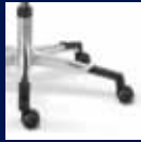
Fußkreuz Aluminium poliert/ Polished aluminum base