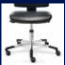
Standard/Standard Bsp./e.g.: IS 20160: 42-58 cm