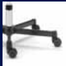
Fußkreuz Stahl schwarz/ Black steel base