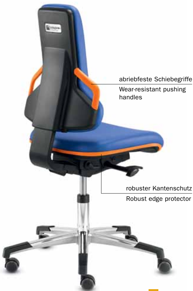
AS+ IS 20260