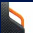
Schiebegriffe/ Pushing handles