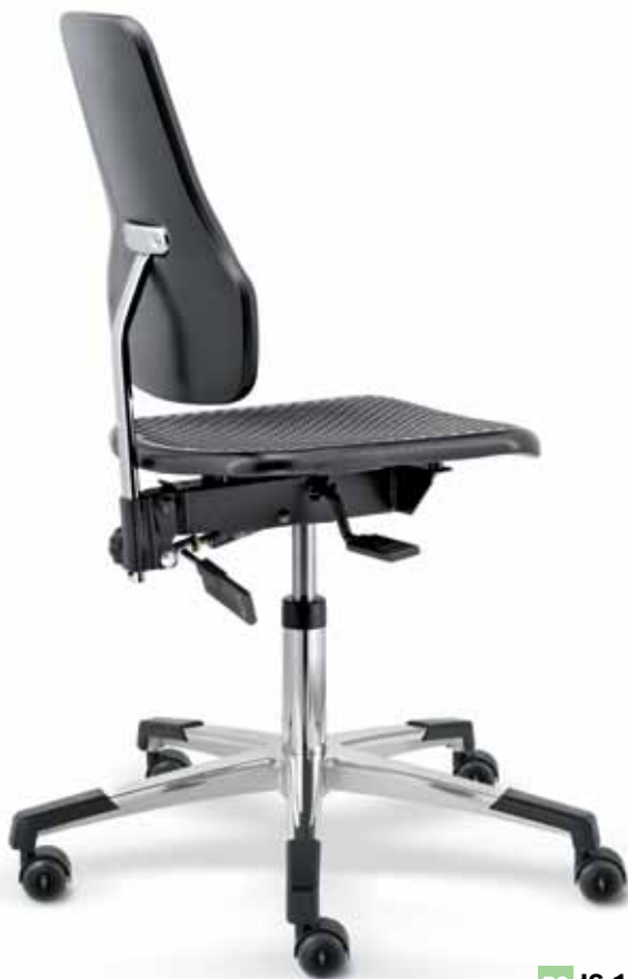
PC IS 19270