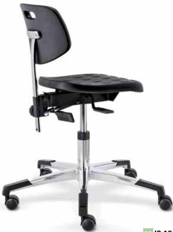
PC IS 19470