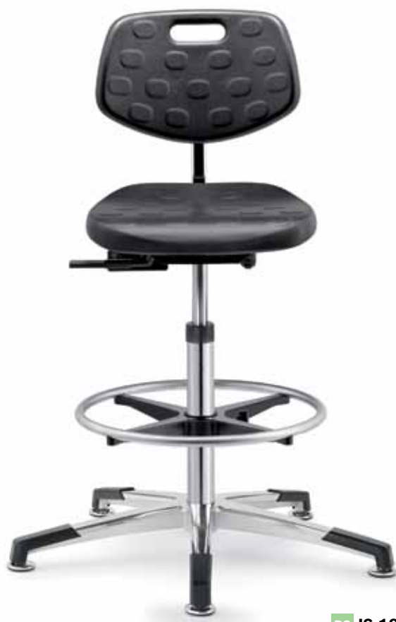
PC IS 19478