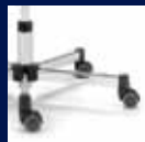
Fußkreuz Stahl verchromt/ Chrome steel base