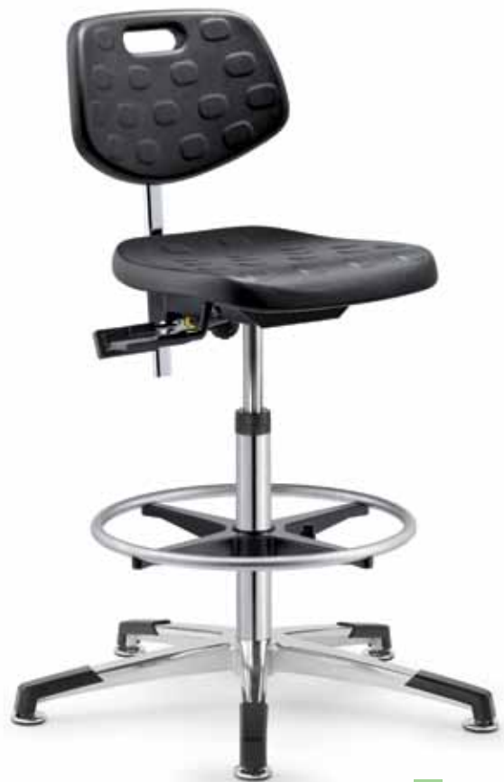
PC IS 19478