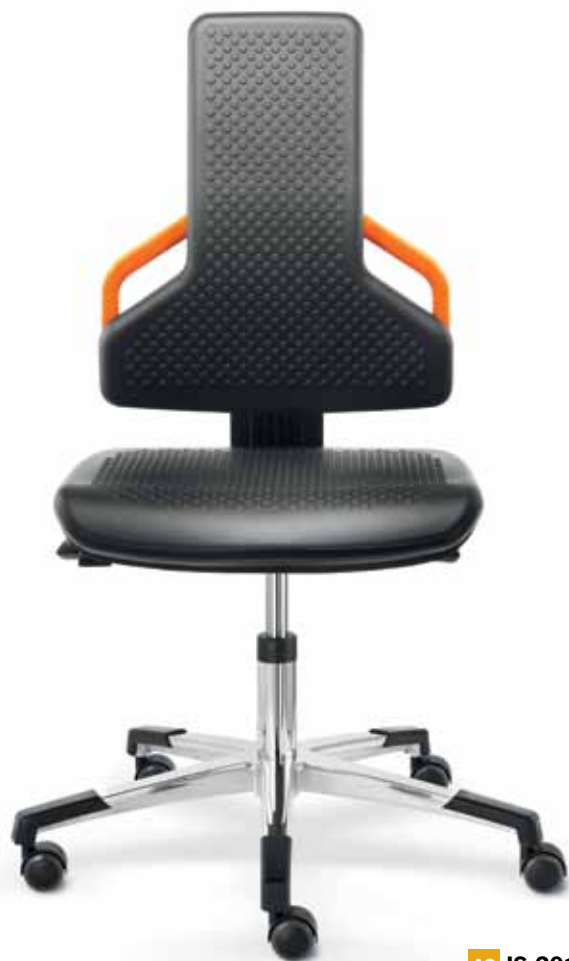
AS IS 20160