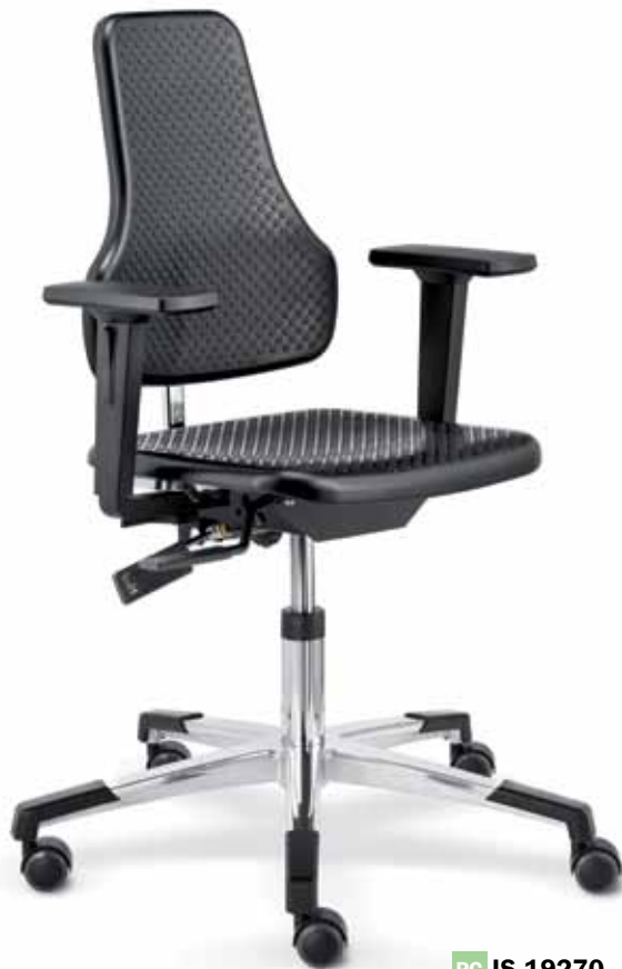
PC IS 19270 + Armlehnen 122