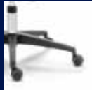
Fußkreuz Kunststoff schwarz/ Black plastic base