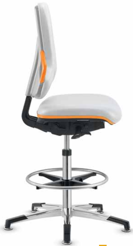
AS IS 20168