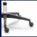
Fußkreuz Kunststoff schwarz/ Black plastic base