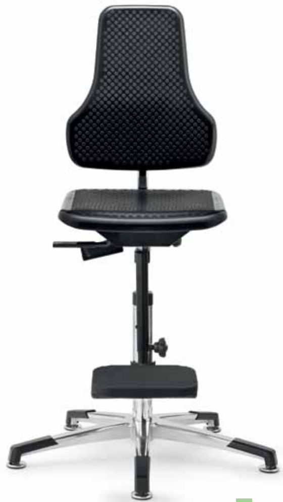
PC IS 19277