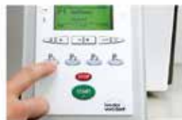
Selección del programa