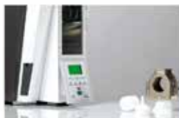
Carga del inyector